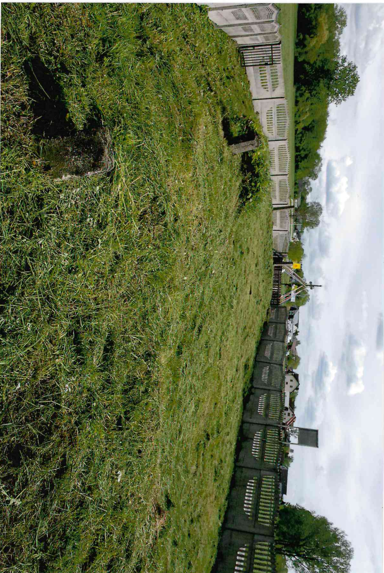
Widok z północnego zachodu

7. Fotografia z opisem wskazującym orientację w stosunku do sąsiednich terenów lub stron świata albo mapa z zaznaczonym stanowiskiem archeologicznym